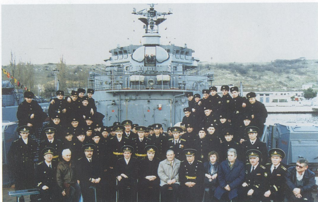
Вместе с командой БДК-67. Сегодня большой десантный корабль Черноморского флота России носит имя «Ямал».