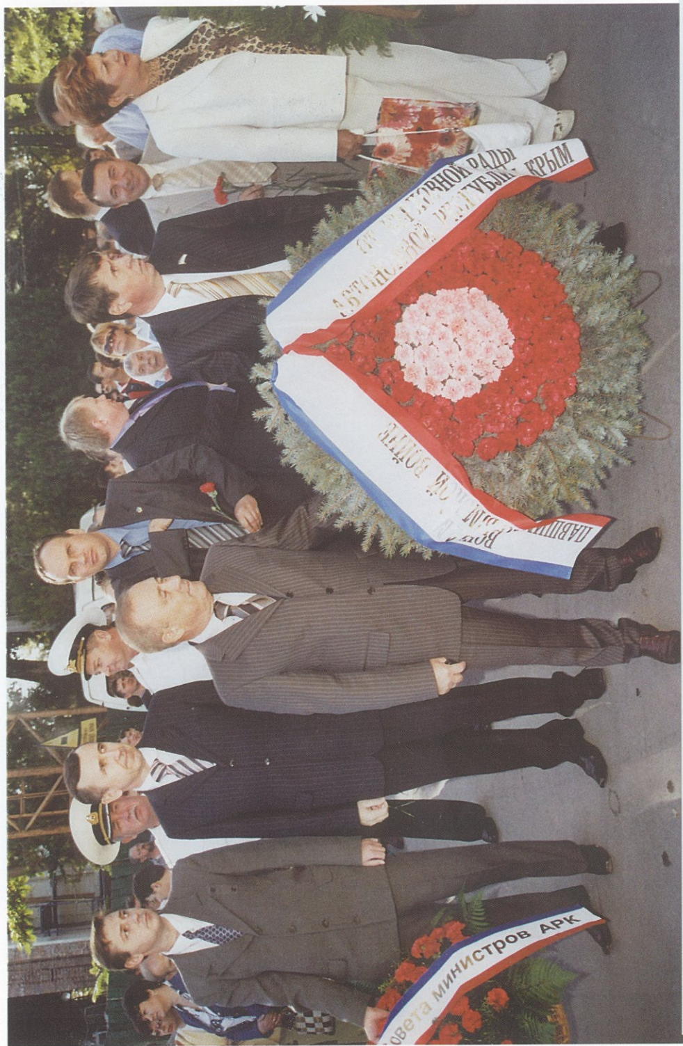
Венок к Долгоруковскому обелиску. 9 сентября 2006 года.