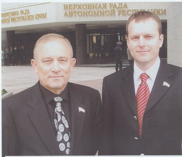
Мы с сыном — депутаты Верховного Совета Крыма. Май 2006 года.