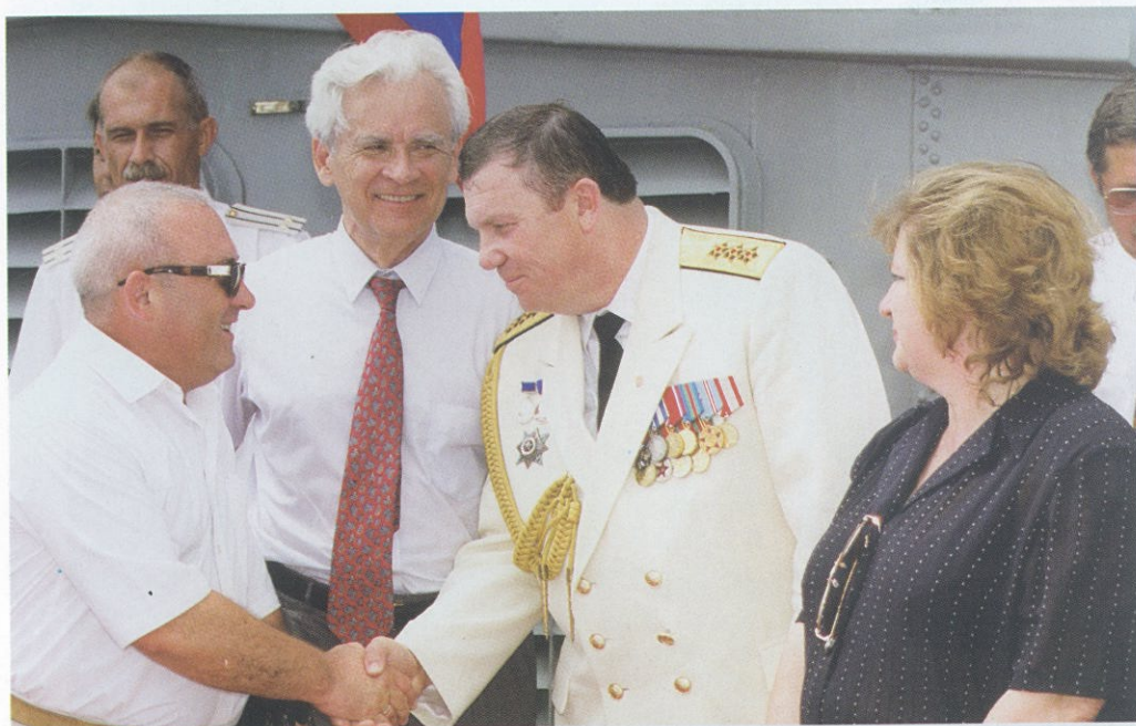
Встреча с командующим Черноморским флотом России адмиралом В. П. Комоедовым на борту крейсера «Москва». В центре — посол России на Украине Ю. В. Дубинин.