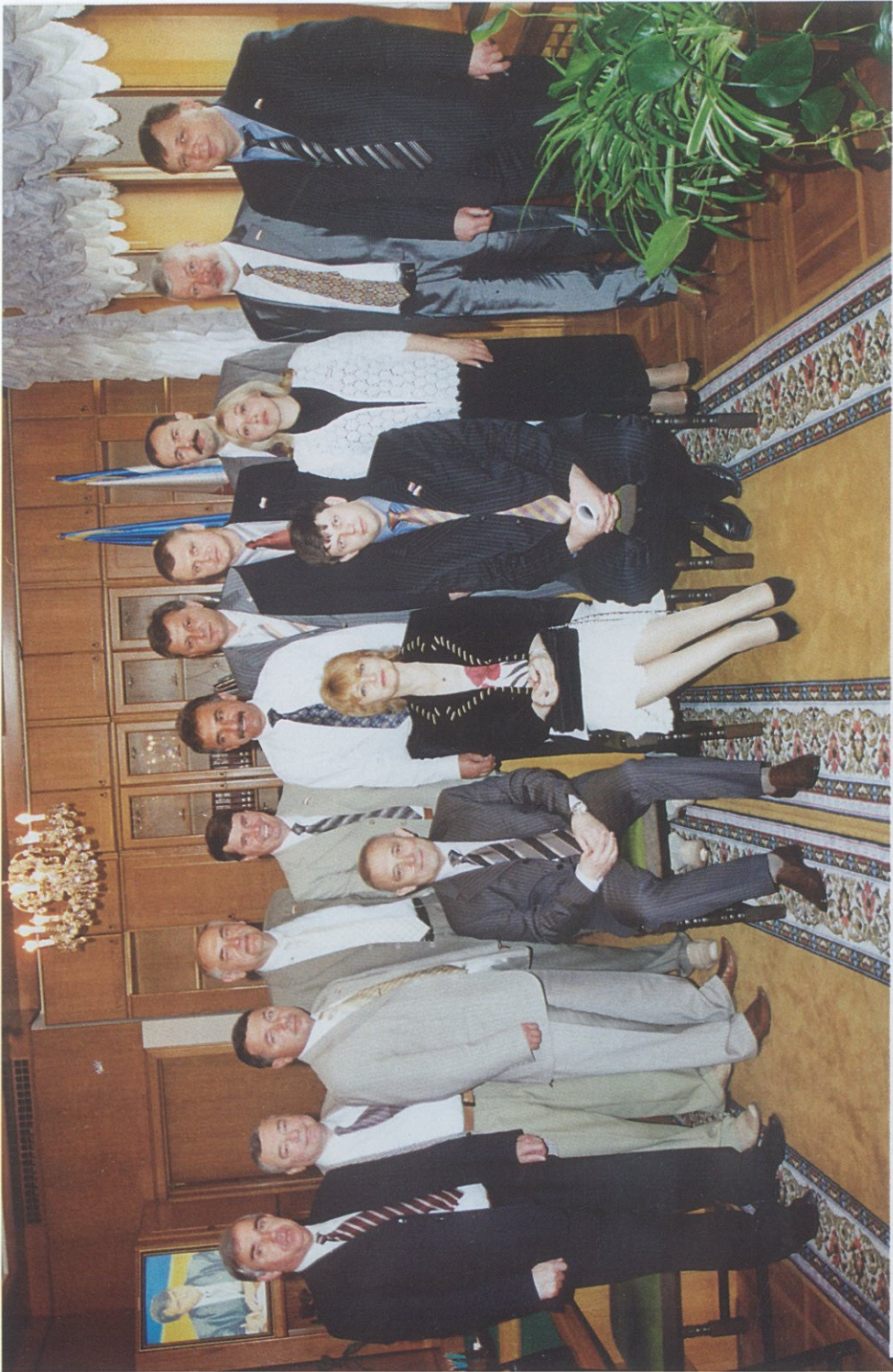
Вновь избранный Президиум Верховного Совета Крыма. 19 мая 2006 года.