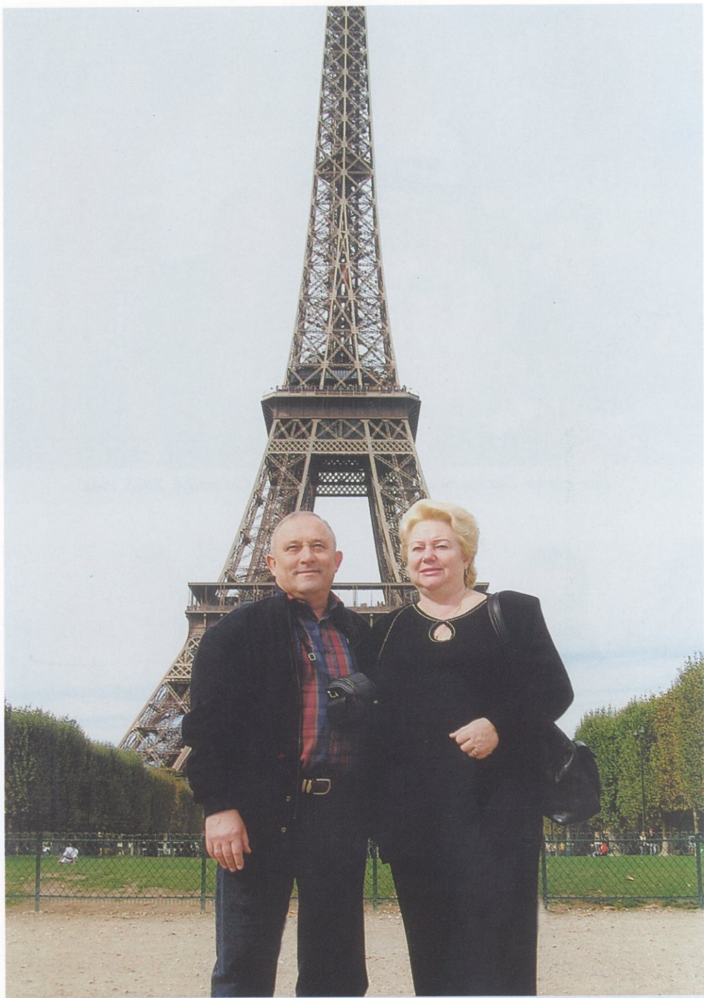
Исполнилась наша с женой давняя мечта — вместе в Париже.