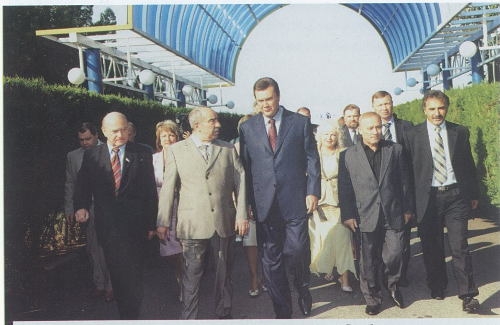
Встреча В. Ф. Януковича в аэропорту Симферополя. 12 июня 2005 года.