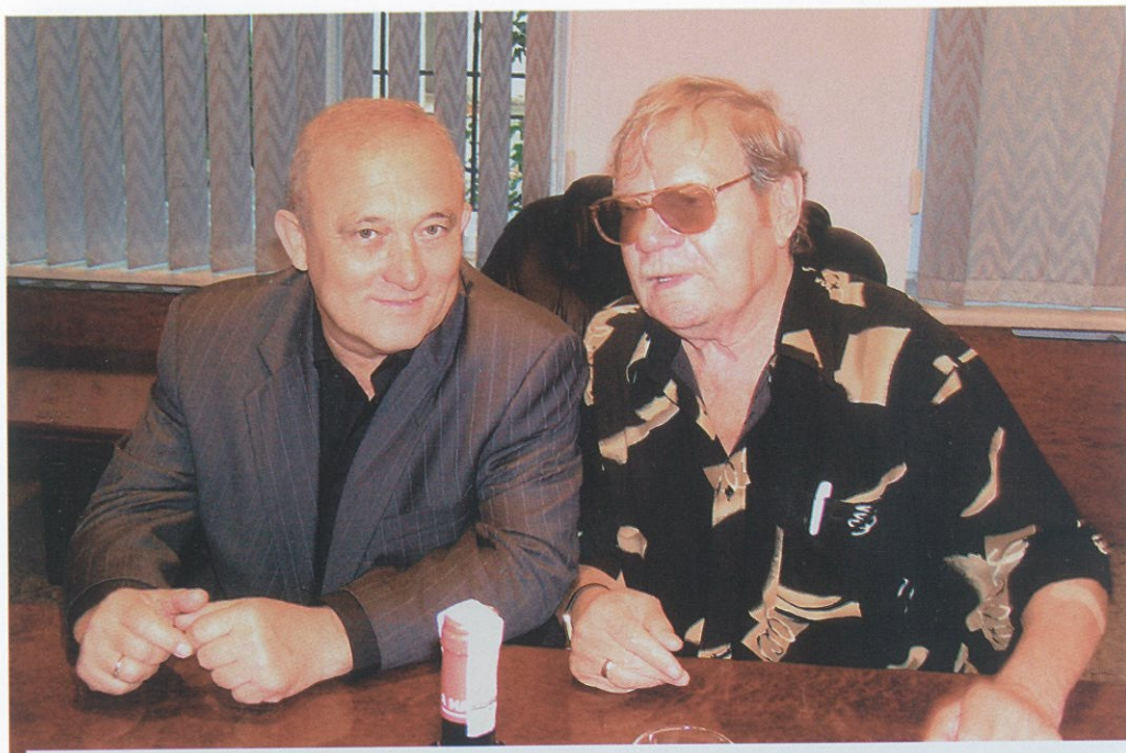
С Михаилом Ивановичем Пуговкиным.