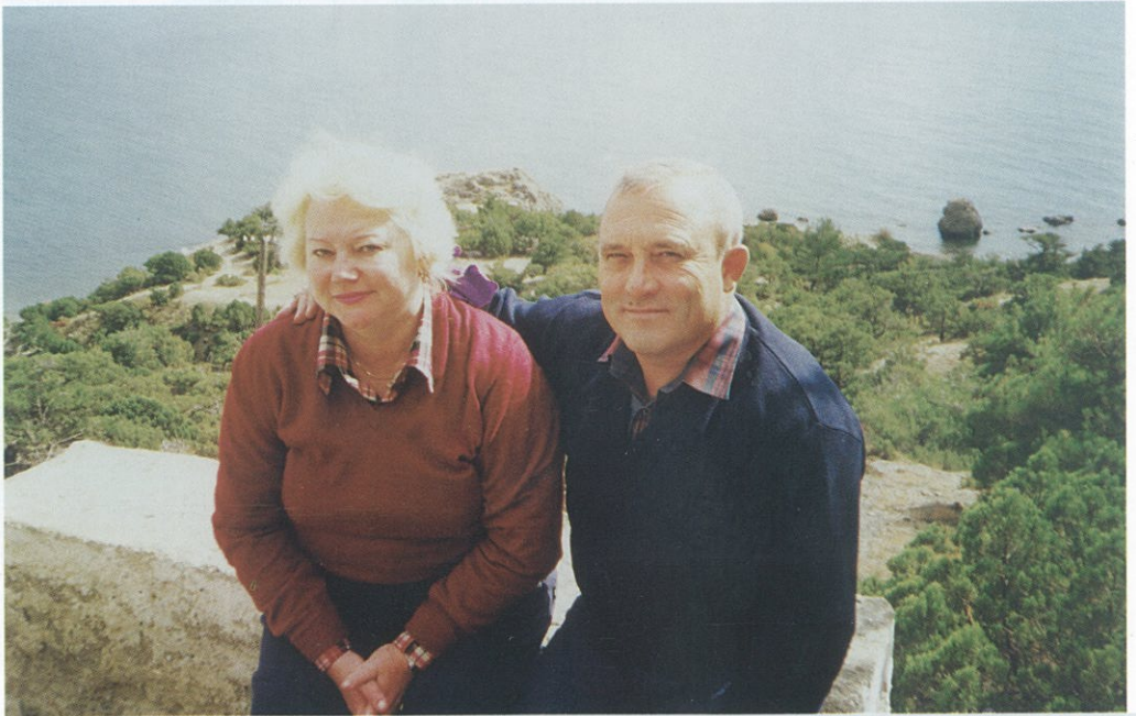
Побережье между Судаком и Новым Светом. Здесь почти 40 лет назад состоялся наш первый совместный отдых.