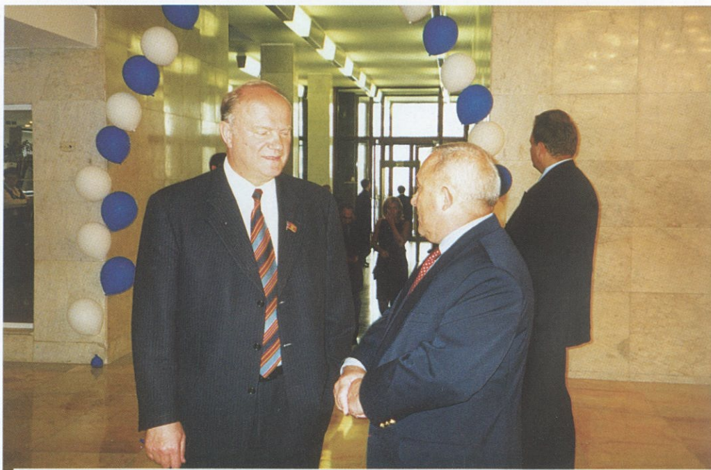
С Геннадием Андреевичем Зюгановым.