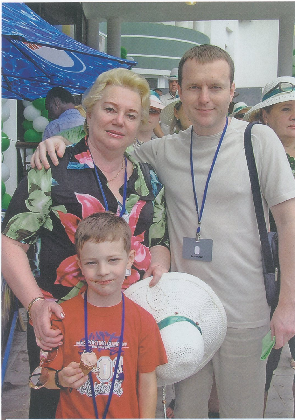
Самое дорогое, что у меня есть.