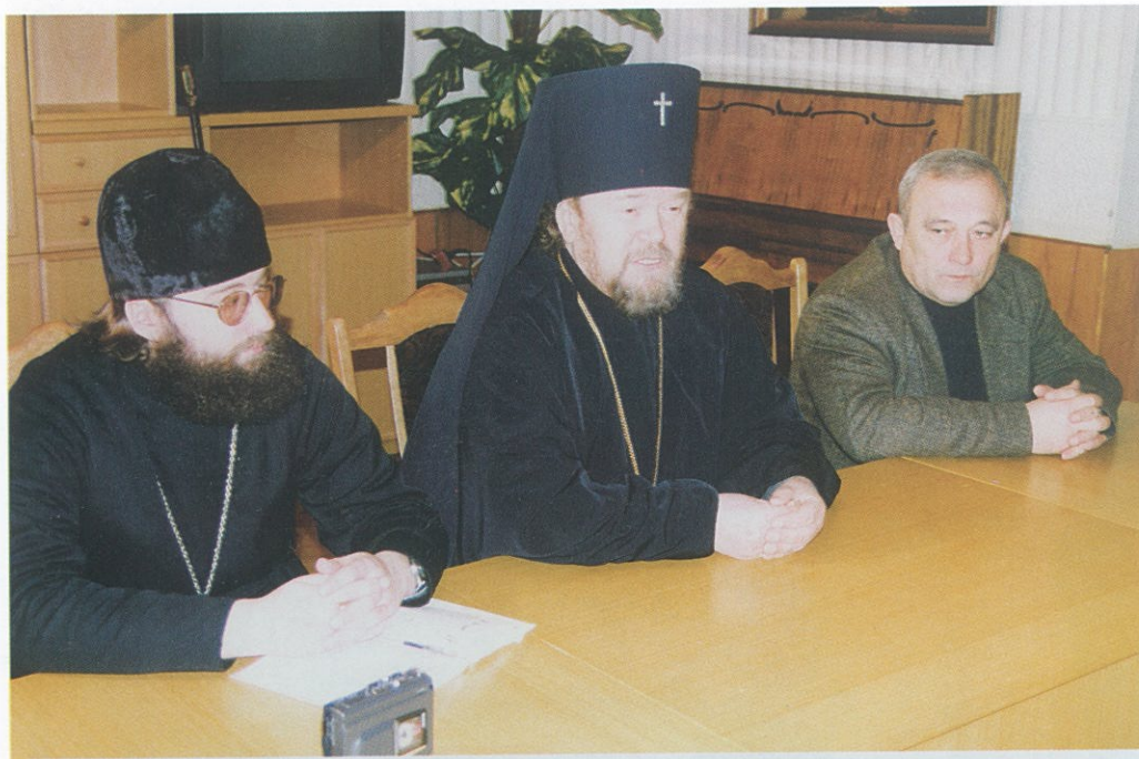
Митрополит Лазарь в гостях у «Крымской правды».