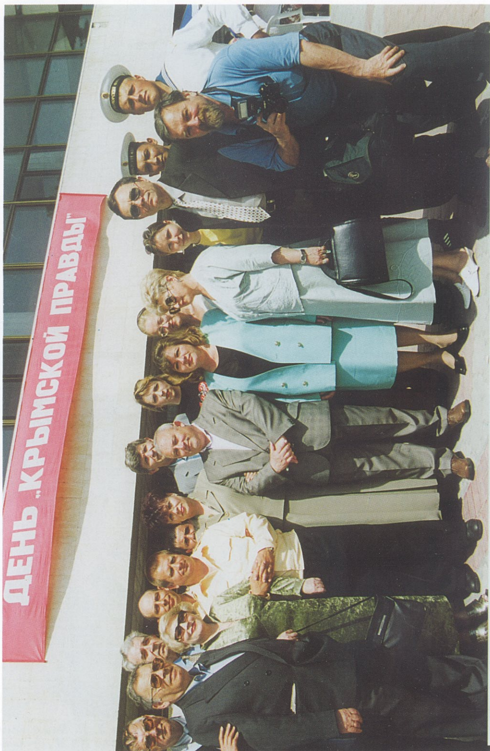
Очередной «День «Крымской правды»».